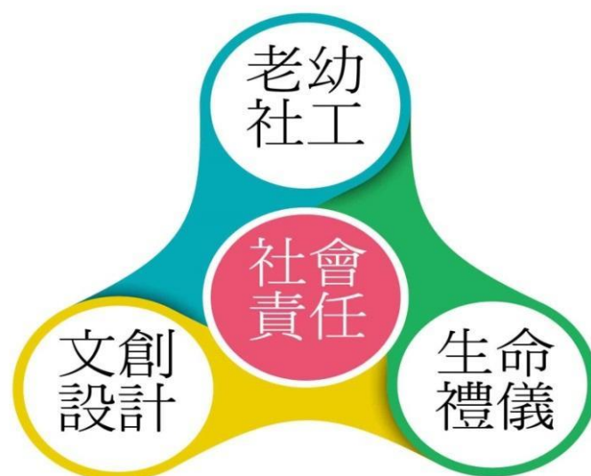
圖 14 人文暨資訊學院發展規劃圖

為因應現今社會發展趨勢，學院長期教育目標規劃將各學術單位依功能性整合為三大發展主軸(圖 14)：以幼保系、社工系為基幹的老幼產業主軸，以文創所為基幹之社造產業主軸，以生命學程為基幹的殯葬產業主軸，其他應日系、數媒系則以其專業背景提供三大主軸執行面所需之知識技能。透過課程與相關計畫，培養學生成為解決高齡化社會衍生問題的專業人才，並實踐大學之社會責任。