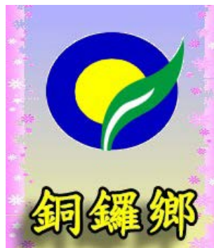
圖 15 銅鑼鄉鄉徽