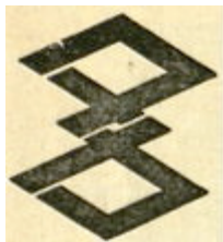
圖 5 高雄市第一代市徽

高雄市第一代市徽由「高」字的片假名「タカ」變體成上下兩菱組成，象徵寶錘；第二代市徽為藍底齒輪，象徵時代巨輪，不斷進步；內含黃色「高」字，代表團結一致，前程光芒燦爛；第三代市徽原為第八屆世界運動會時之會徽，後因舊市徽不合時宜，遂被提案成新市徽。外形像「高」字組成的舞動彩帶，象徵「和諧、友誼、律動、飛躍、進步」，起筆的昏黃色代表旭日光輝，收尾的藍色則是藍色浪花。