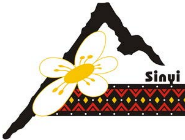
圖 12 信義鄉鄉徽

萬巒鄉鄉徽之意象鮮明，整體看起來像不像「巒」，上半部是以客家傳統建築「馬背」結構，結合中國吉祥如意雲紋圖案，意喻客家先鋒堆歷史涵義及綿延不絕的文化傳承。