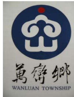
圖 13 萬巒鄉鄉徽